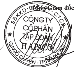
Vũ Xuân Cường