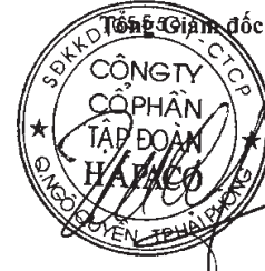
Vũ Xuân Cường